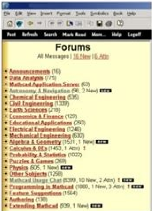
Figure 3-2: Opening the User Forums from the Resources window.